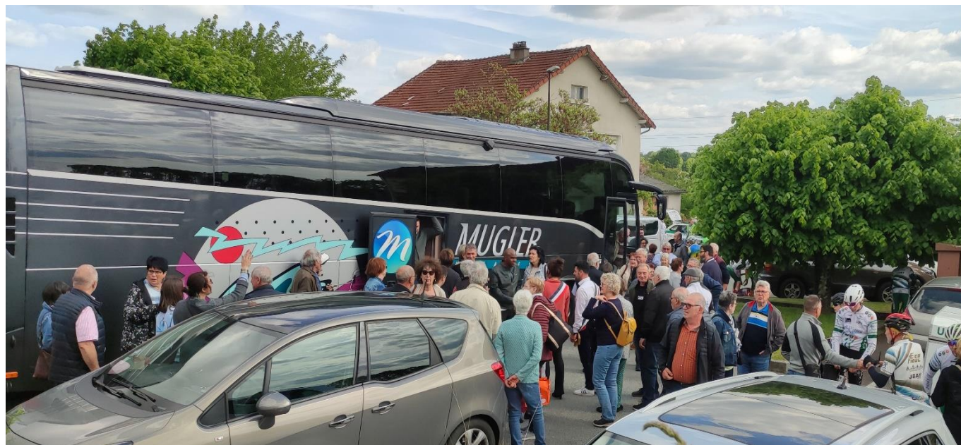
Arrivée des Forstfeldois en mai 2023

Nous comptons une nouvelle fois sur votre implication et participation et nous vous en remercions à l'avance.