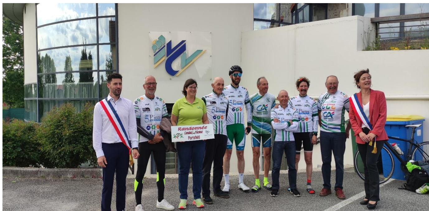
Arrivée des cyclistes condatois qui sont partis de Forstfeld en mai 2023 pour revenir à Condat sur Vienne en prenant la route qu'avaient dû prendre nos évacués en septembre 1939