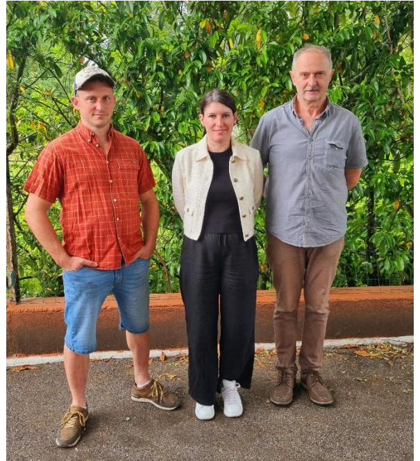
La commission « Sécurité » composée de :

Par son action quotidienne et sa vigilance, la commission sécurité participe pleinement à la qualité du service public et à la tranquillité de chacun des habitants de Forstfeld.